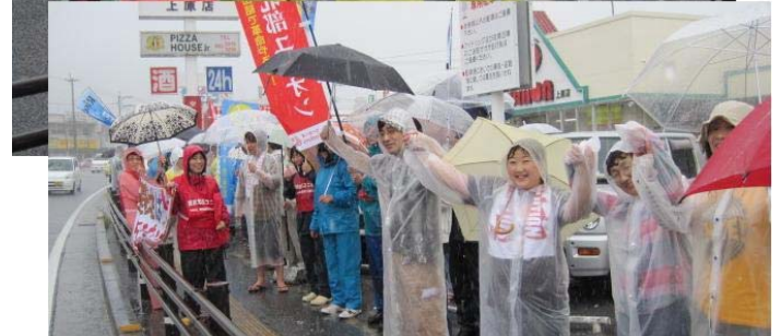
5・16 普天間基地包囲行動(街HPより無断借用)